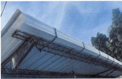
Foto 9 :7.4 Sustitución de bajada de agua pluvial de metal por tubo PVC 3"