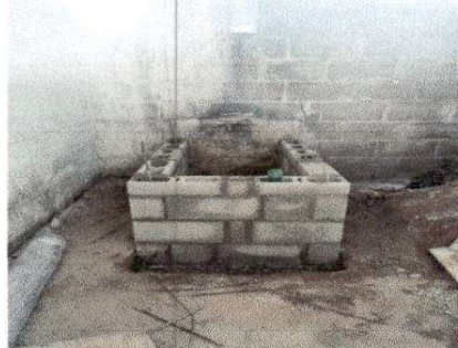
Foto14: 20.2 Sustitución de estufa rural incluye chimenea