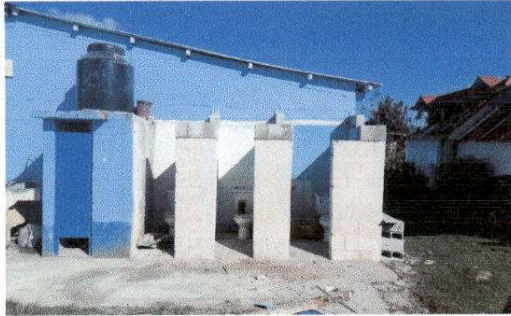
Foto1: 2.2 Sustrucción de Estructura de Madera por Metal