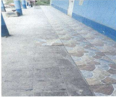
Foto7: 6.7 Sustitución de piso de granito